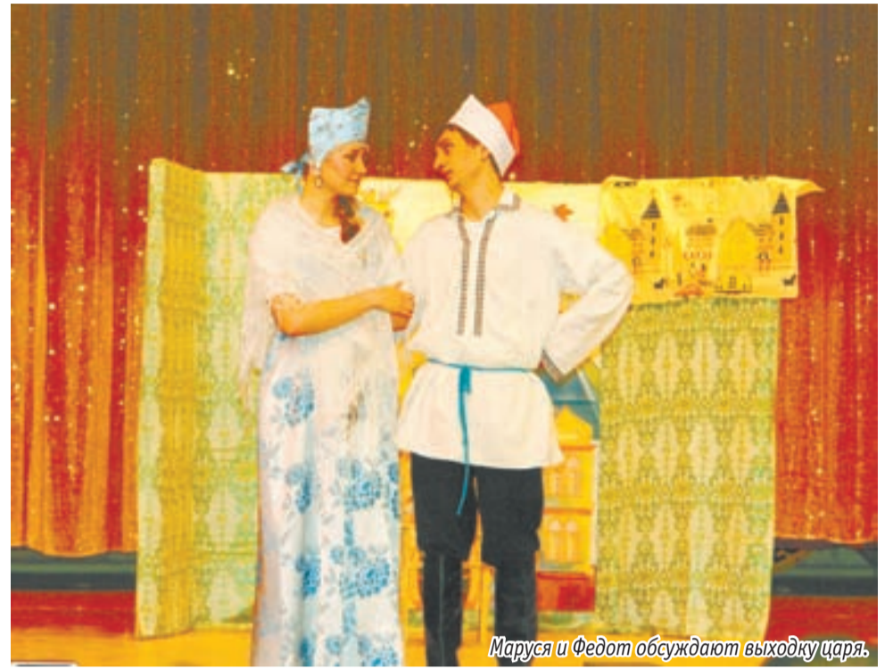
Маруся и Федот обсуждают выходку царя.

чудес» считают и люди знающие, поэтому актеров «Поля чудес» приглашают на различные мероприятия. Так, например, в прошлом году они участвовали в Ночи музеев, представив пришедшей в Ессентукский краеведческий музей публике спектакли по рассказам А. П. Чехова «Злоумышленник» и «Беззащитное существо». К слову, декорациями для этих постановок стали картины ныне питерского, а ранее кавминводского художника Полякова.