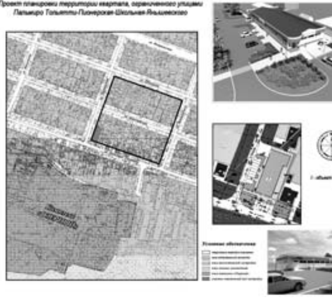
План размещения территории квартала, ограниченного улицами Пальмиро Тольятти-Пионерская-Школьная-Нынешское