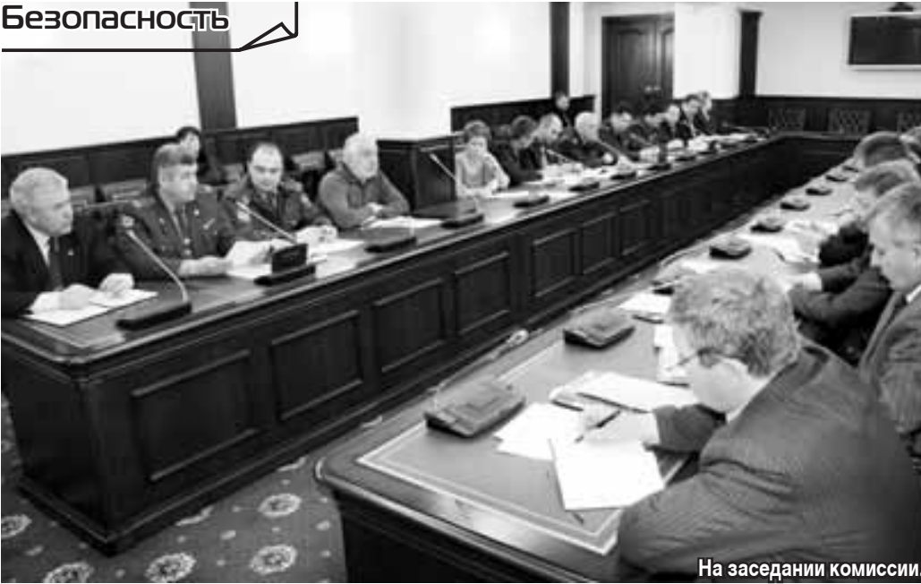
На заседании комиссии.