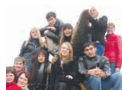
Полосу подготовила Татьяна ПАВЛОВА.