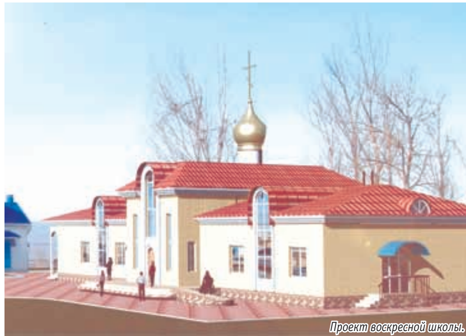
Проект воскресной школы.

— Какие задачи перед собой ставит воскресная школа сегодня?