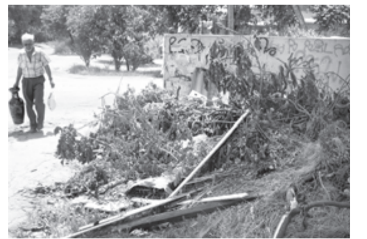
Свалка на улице Ессентуской, 27а.

БЕСЕДЫ, лекции, встречи с бывшими наркозависимыми — членами православного братства Святого духа в вузах, школах, а в летнее время и пришкольных лагерях в городе-курорте не прекращаются. С участием специалистов наркодиспансера осуществляется выявление склонных к употреблению наркосодержащих средств и распитию горячительных напитков малолеток. Медико-социальные патронажи в неблагополучные семьи — еще одна из составляющих деятельности, осуществляемой специалистами наркодиспансера. С родителями и их детьми беседуют врачи-психологи. Беседы и занятия проводятся с молодыми мамами, инициирована работа с молодежью по формированию здорового образа жизни.