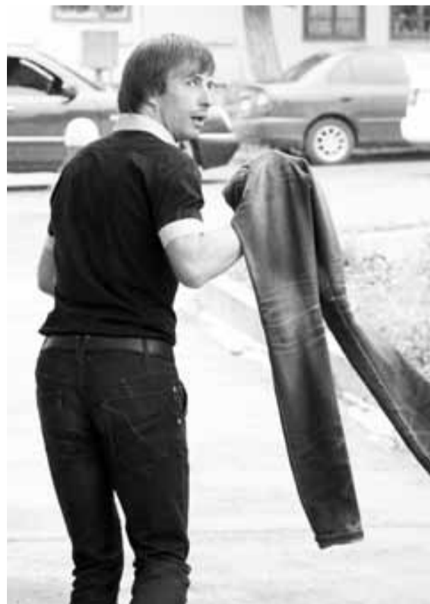
Полосу подготовила Татьяна ПАВЛОВА.