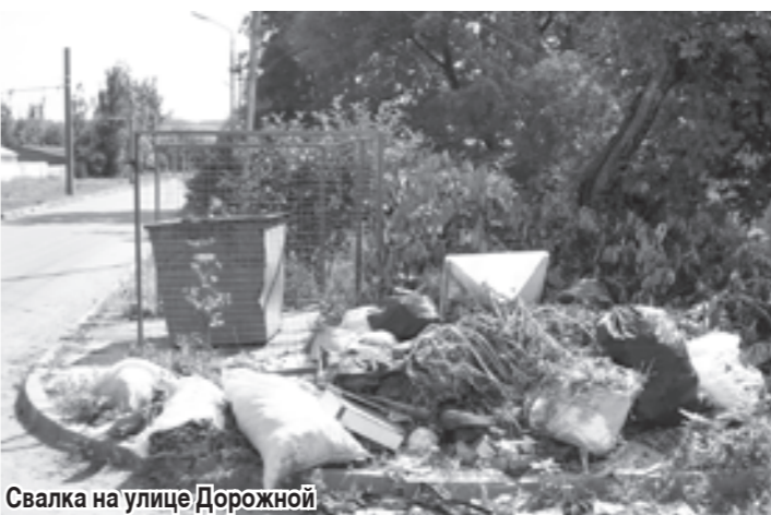
Свалка на улице Дорожной

таза, строительные отходы, обувь мужская, пакеты с бутылками, по свидетельству жильцов, свалка не вывозилась 10 дней;