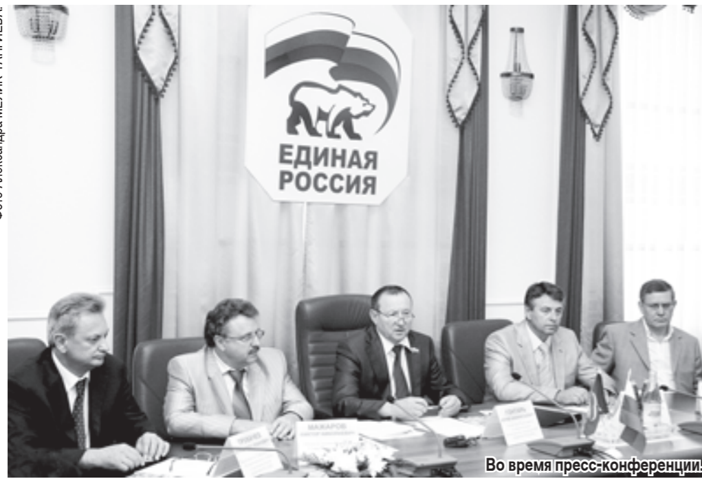
Во время пресс-конференции.

санаторно-курортного комплекса «Горное море» у подножия горы Развалки. Нельзя не оценить значимость не только для края, но и всего СКФО программы реконструкции детского оздоровительно-образовательного центра «Машук» в Пятигорске, рассчитанного на ежегодный прием 10 тыс. человек. В нем будут со