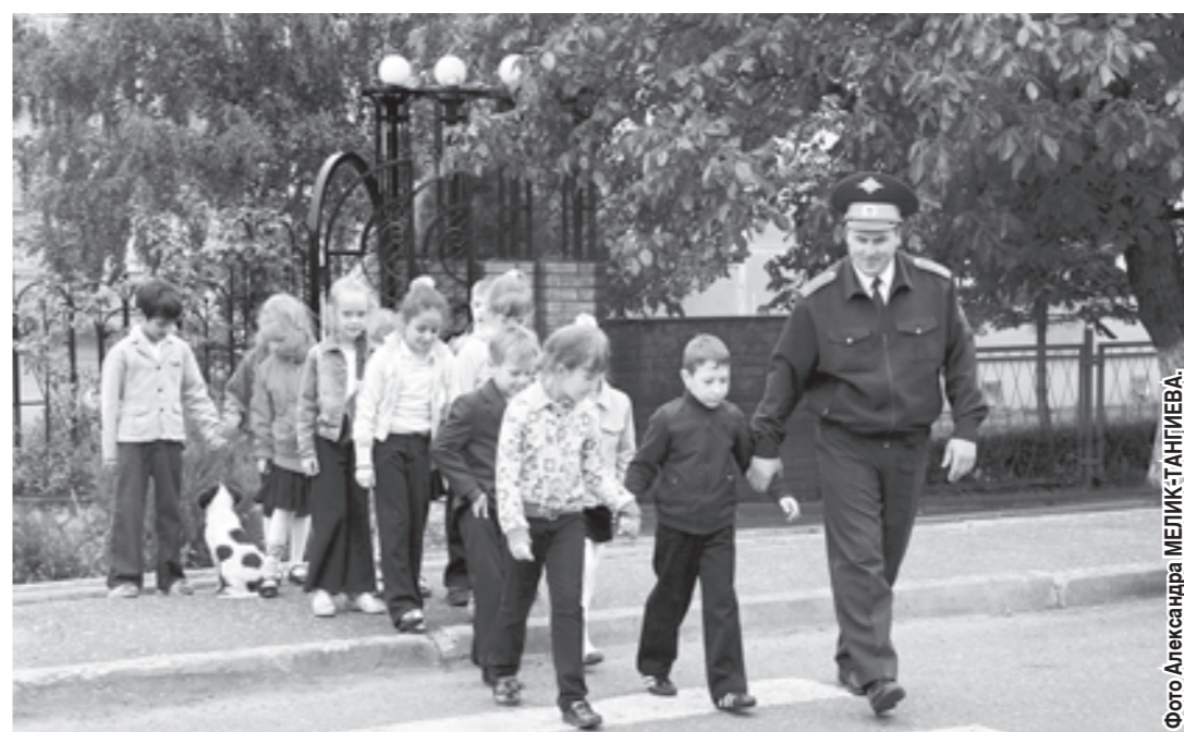
Третьего июля отмечается 74-я годовщина образования ГАИ-ГИБДД.