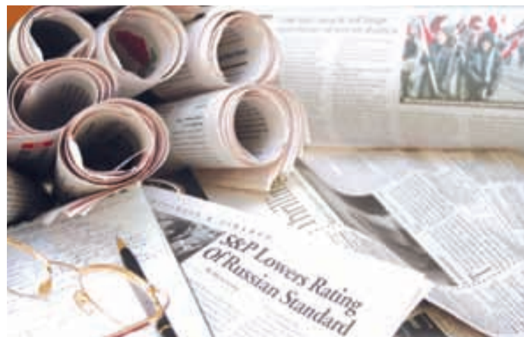
Полосу подготовил Сергей ДРОКИН.

Имеются и другие определения, но все они лишь приукрашивают главный постулат, и ни одно из них не выдерживает критики. В России есть предостаточно умелых, ушных, целеустремленных и амбициозных людей (можно в этой связи сослаться на ста-