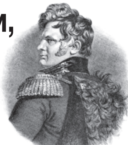
А. П. Ермолов. Гравюра XIX века.