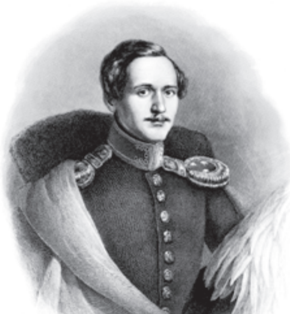
М. Ю. Лермонтов. Гравюра XIX века.

Лермонтов также всегда питал к «проконсулу Кавказа» почтительное уважение. В то время, когда он писал «Героя», Ермолов давно пребывал в опале, и появление его имени на первых же страницах романа могло выглядеть вызывающе. Тем не менее оно прозвучало здесь несколько раз. Дважды — в устах Максима Максимыча, благоговейно упомянувшего «Алексея Петровича», при котором он «получил два чина». Бравый штабс-капитан, как старый кавказец, не имел нужды пояснять попущику, о каком именно Алексее Петровиче идет речь, и автор, дабы не оставлять в неведении своих читателей, вынес фамилию генерала в отдельное примечание.