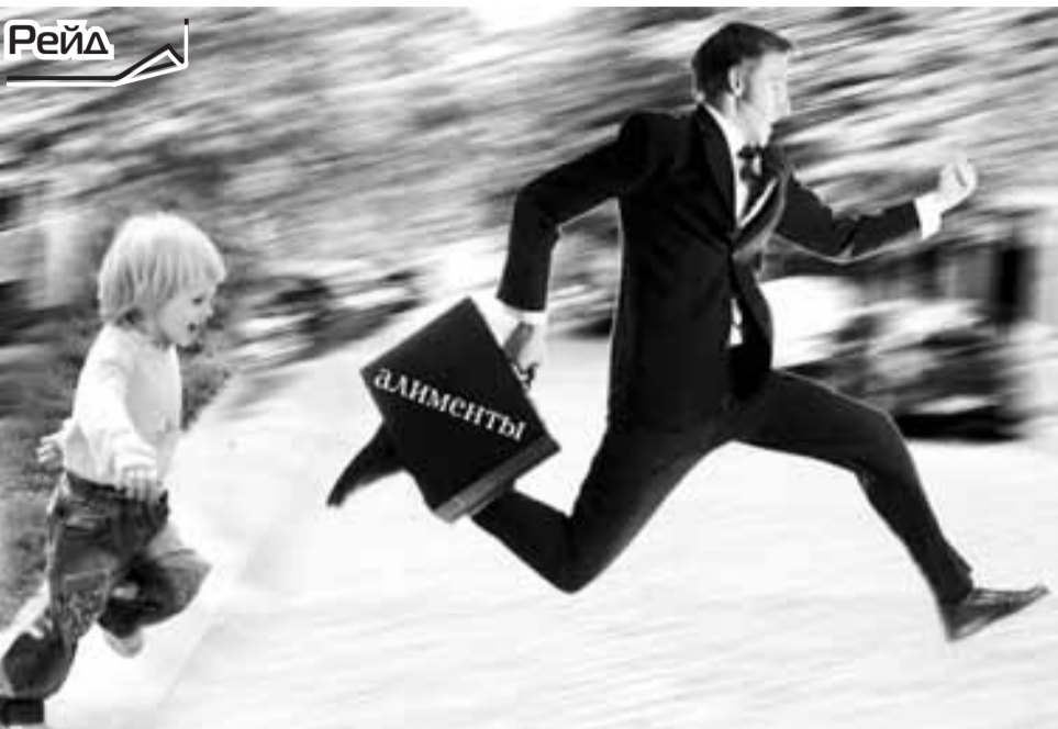
Фотомонтаж Александра МЕЛИК-ТАНГИЕВА.