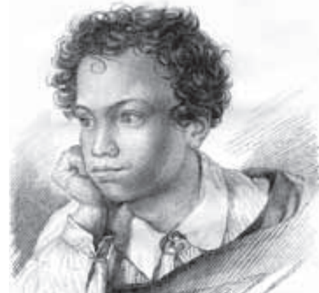
А. С. Пушкин. Портрет, приложенный к первому изданию поэмы «Кавказский пленник».

Здесь Пушкин имеет в виду итальянский поход Наполеона 1796 года. На Востоке в это время русские войс-