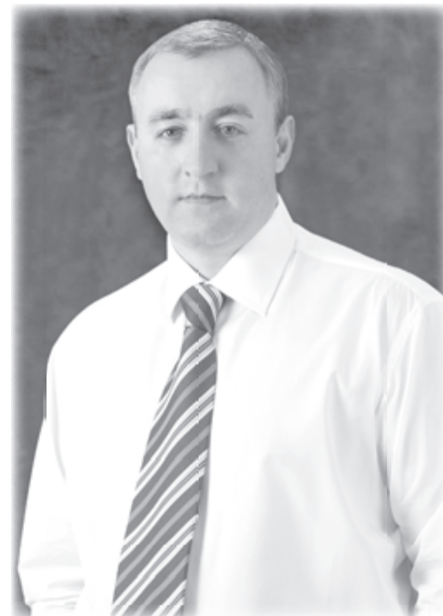
Лев ТРАВНЕВ, кандидат на должность главы города Пятигорска от Всероссийской политической партии «ЕДИНАЯ РОССИЯ»