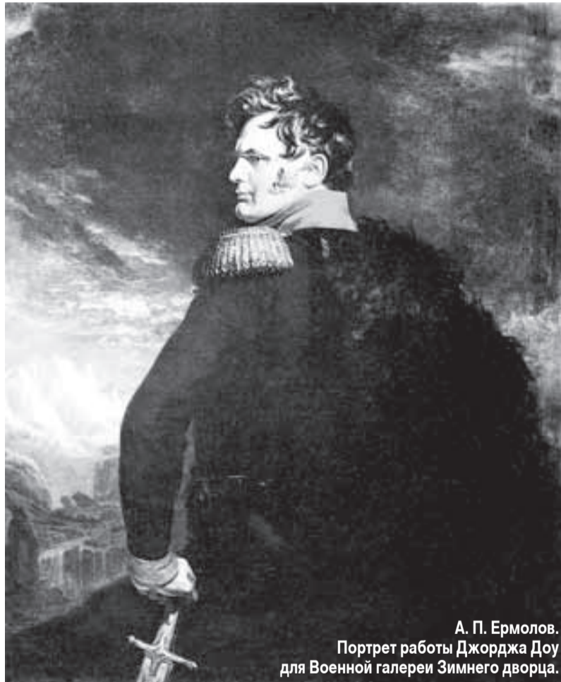
А. П. Ермолов. Портрет работы Джорджа Доу для Военной галереи Зимнего дворца.

Вероятно, что в Ермолове Пушкин видел героя своих будущих произведений. Удовлетворив свои исторические интересы в созданных образах Петра и Пугачева, он искал возможности запечатлеть современную ему личность исторического масштаба. В том, что поэт именно так подходил к оценке Ермолова, сомневаться не приходится: в его письмах дважды встречается весьма характерное в этом отношении (хотя и косвенное) сопоставление Ермолова с Наполеоном. Сохранилось