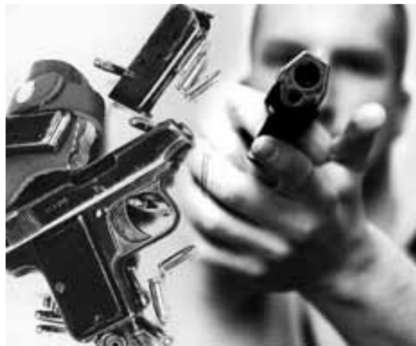
Фотомонтаж Александра МЕЛИК-ТАНГИЕВА.

Для многих оружие — символ свободного человека и гарантия его безопасности. Что касается последнего, то для обеспечения оной существуют органы правопорядка.