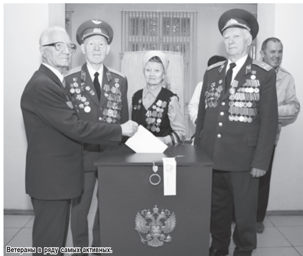
Ветераны в ряду самых активных.