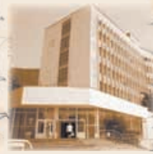
Полосу подготовила Марина КОРНИЛОВА.

1965 г. Вступила в строй здравница «Ленинские скалы» на 700 мест, построенная по проекту А. Г. Тарасова.