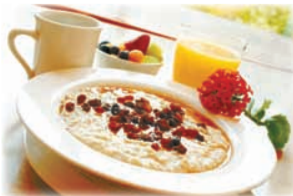
Полосу подготовила Наталья НОСОВА.

Дело в том, что овес обладает выраженными противовоспалительными свойствами и улучшает работу иммунной системы. Подобными свойствами обладает и рыба.