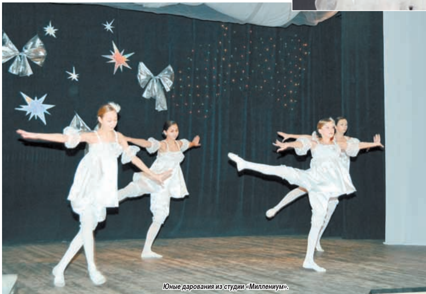
Юные дарования из студии «Миллениум».