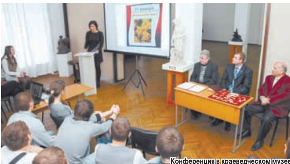
Конференция в краеведческом музее.

го года, вручили благодарственные письма от отдела по делам молодежи городской администрации. А после перешли к традиционному, с соблюдением всех ритуалов посвящению новобранцев в ряды РСМ. Выделялся на фоне остальных сорока вступающих в молодежную организацию не школьник, и даже не студент, а аспирант, известный на всю