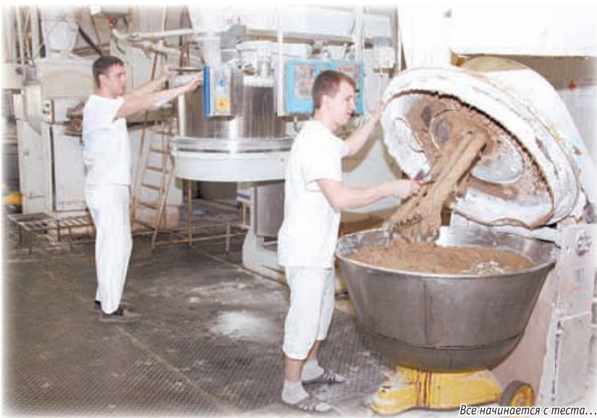
Все начинается с теста...