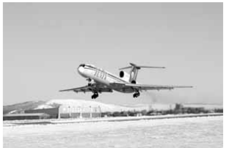
Полосу подготовила Наталья НИКИТИНА.

Его стоимость может поднять и тот факт, что в 2014 году, во время Олимпиады в Сочи, аэропорт будет выполнять роль запасного.