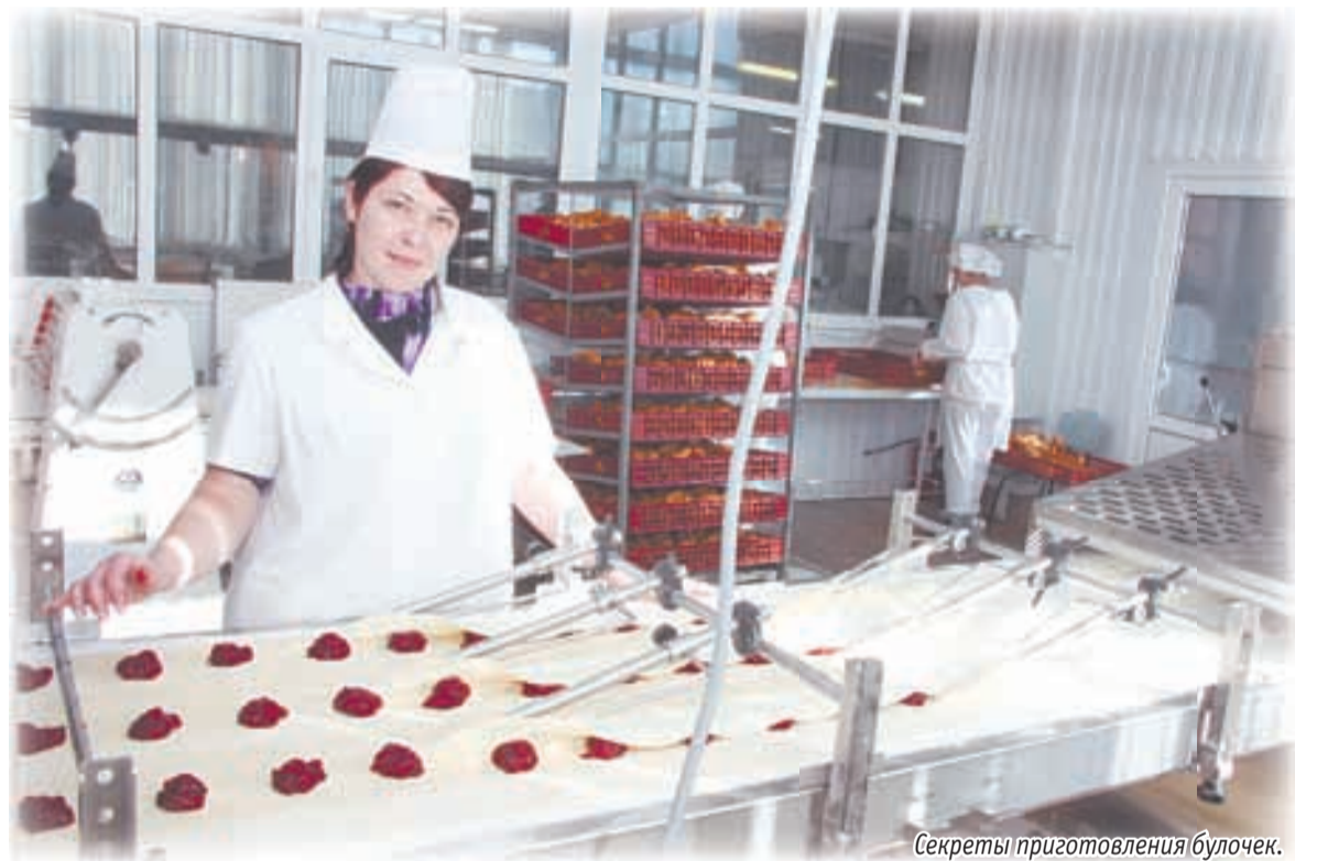
Секреты приготовления булочек.

— Ой, много всего. На наших грядках краснеют томаты, растут огурцы. Ну и как же без картофеля? Мы и его культивируем. А потом, когда насту-