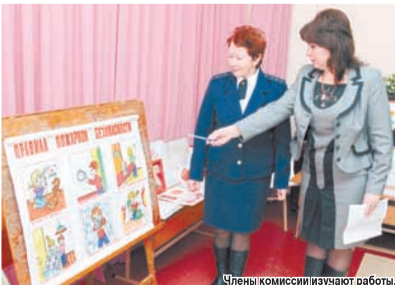
Члены комиссии изучают работы.

В городском конкурсе приняло участие 33 детских сада, прислано 125 ра-