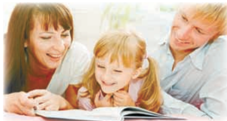
Полосу подготовила Элла СЕХПОСОВА.

При общении нужно уметь проявлять уважение к эмоциям и чувствам сына или дочери, а также интересам и переживаниям. Ни в коем случае не давайте ребенку понять, что его занятие является не очень интересным для вас. Докажите ему то, что вы будете его любить таким, какой он есть, вместе с его интересами, успехами, неудачами и страхами. Никогда не смейтесь над его желаниями и не оскорбляйте чувства своего чада. Попытайтесь избежать любые насмешки, а также постарайтесь не ставить ребенка в неловкое положение перед чужими людьми.