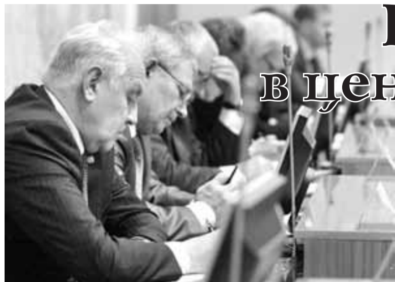
Положение с доставкой пенсий в Ставрополе остается в центре внимания исполнительной власти края. На еженедельном совещании правительства региона, которое провел губернатор Валерий Гаевский, было рассмотрено выполнение его поручения о нормализации поступления выплат пенсионерам.

Глава края отметил произошедшие за минувшую неделю сдвиги. Дополнительное привлечение к регулированию ситуации сотрудников аппарата территориального управления Пенсионного фонда, почтового ведомства, волонтеров позволило довести показатель доставки пенсий до 98 проц. от плана при среднероссийском отставании в 2,5 проц.