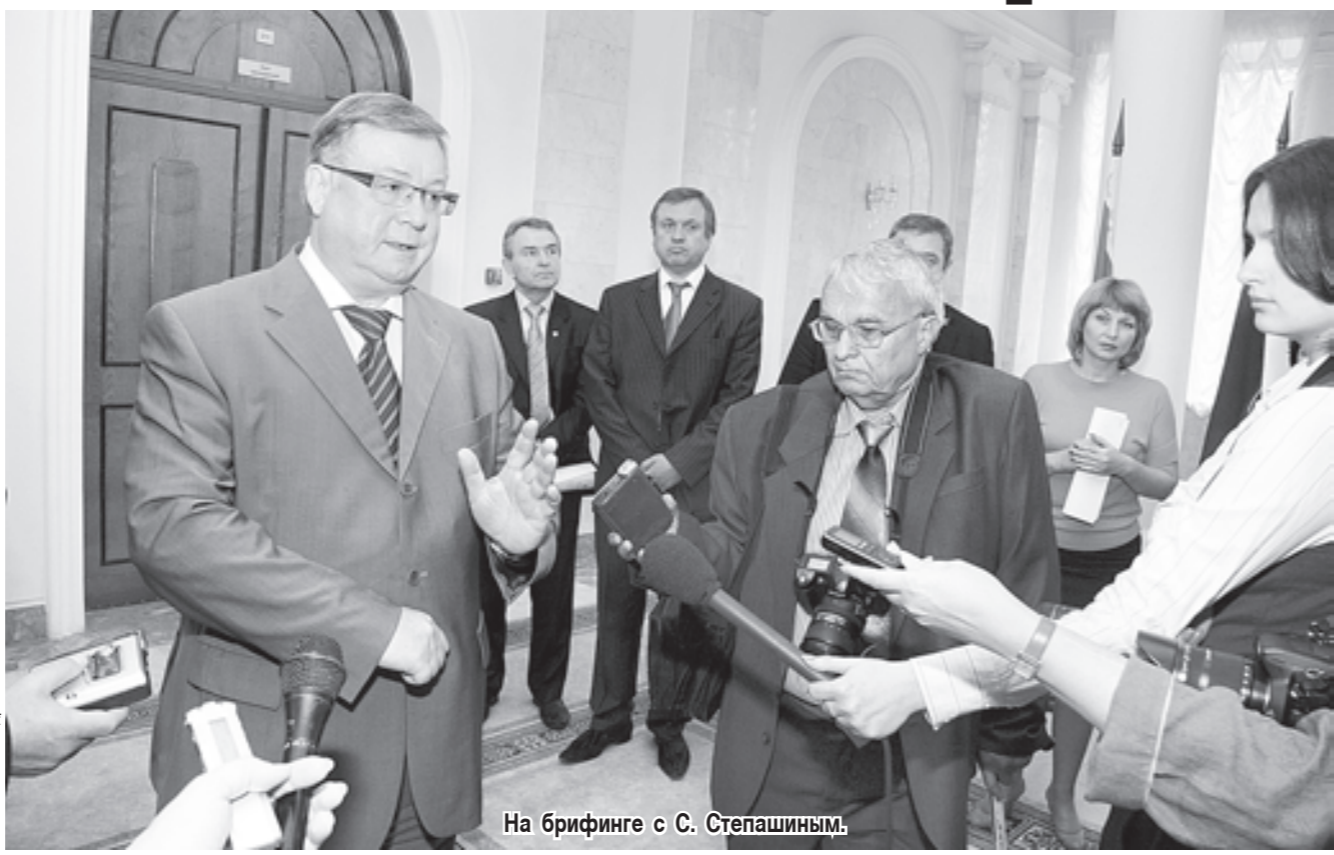
На брифинге с С. Степашным.

На этой неделе председатель Счетной палаты Российской Федерации, председатель Ассоциации контрольно-счетных органов РФ Сергей Степашин посетил Карачаево-Черкесию, Кабардино-Балкарию, Чеченскую Республику с целью проведения контрольных мероприятий. Итоги проверки были рассмотрены на рабочем совещании в резиденции полпреда президента в СКФО, где также прошел семинар, посвященный взаимодействию региональных контрольно-счетных органов со Следственным комитетом РФ.