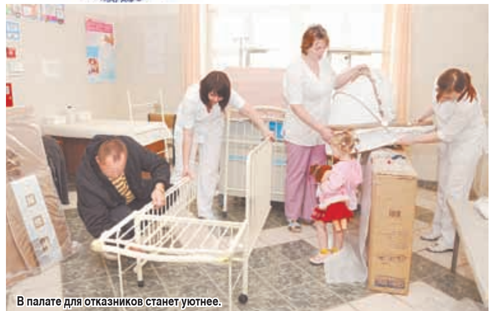
В палате для отказников станет уютнее.