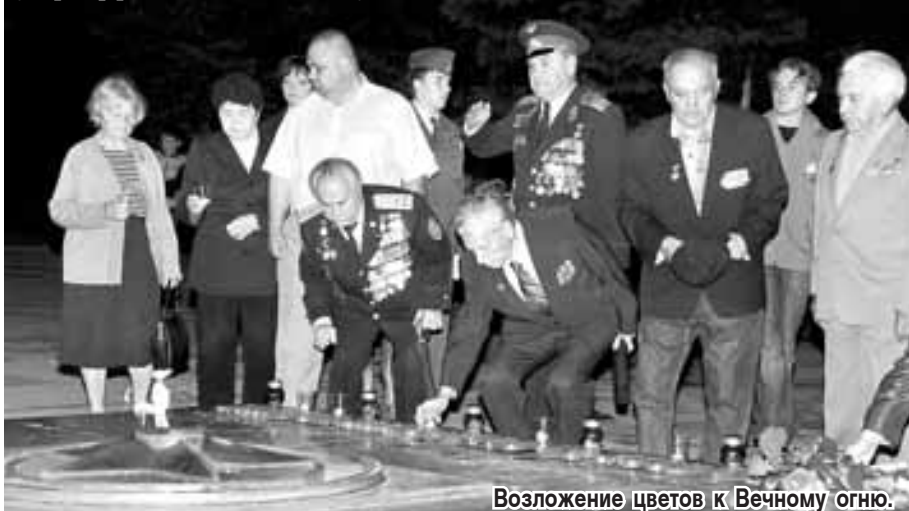
Возложение цветов к Вечному огню.