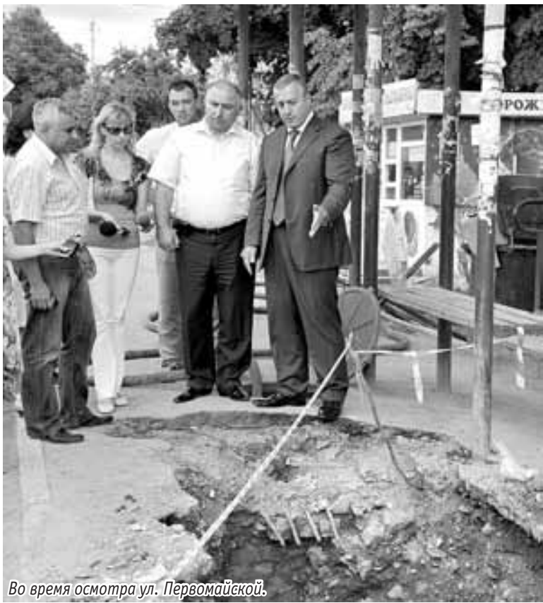
Во время осмотра ул. Первомайской.

На всех этих участках сегодня сосредоточено немало количество техники и специалистов. Ремонт дорог ведется практически без полного перекрытия транспортного движения, хотя в рамках комплексной программы осуществляется перенос инженерных коммуникаций, установка бордюров, обустройство разделительных полос и т.д.