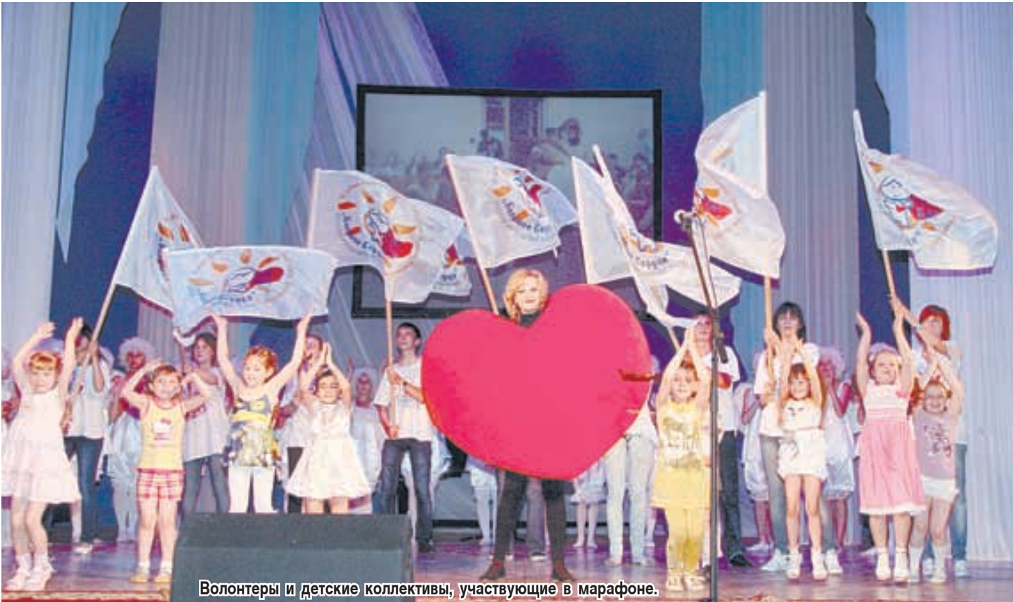
Волонтеры и детские коллективы, участвующие в марафоне.