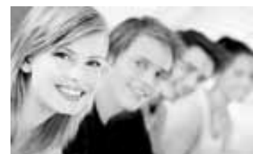
Полосу подготовила Дарья КОРБА.

Недавно в Махачкале состоялся фестиваль молодежи Кавказа «Дружба народов – единство России». На четыре дня к теплоту Каспийскому морю приехали лидеры и активисты молодежных и национально-культурных объединений, студенты вузов ЮФО и СКФО. Основной целью фестиваля стало формирование идеи духовного единства, дружбы народов, межнационального согласия с учетом различных традиций и обычаев.