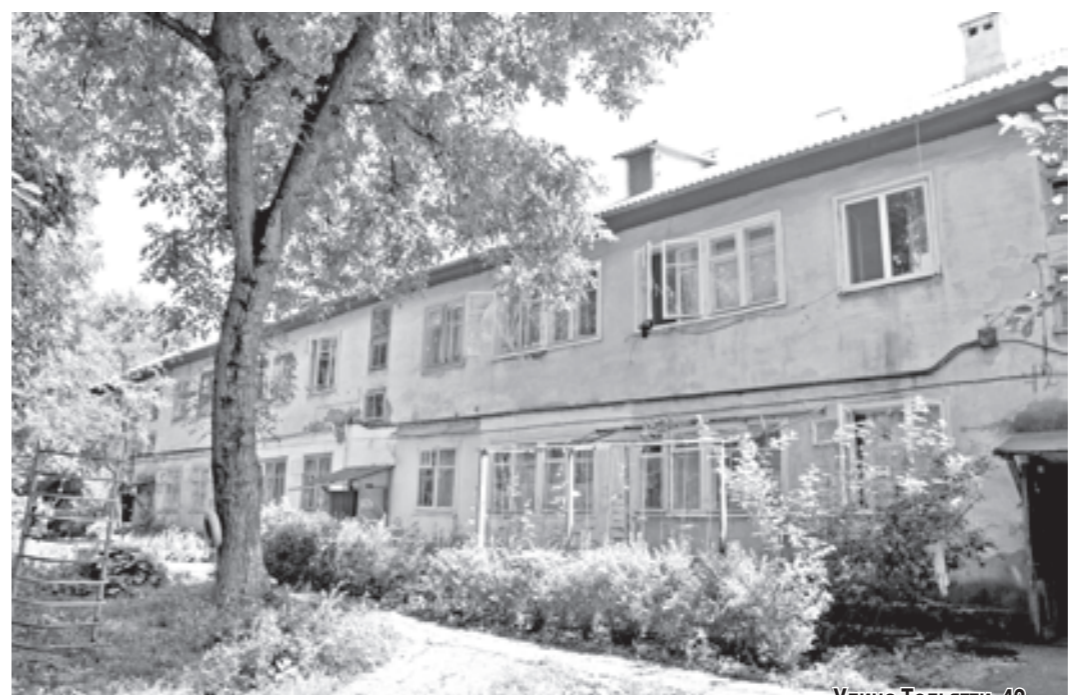
Улица Толстяги, 42.

Пятигорска в период первых четырех месяцев 2010 г., а также с ноября 2010-го до февраля 2011-го не проводилась. Тогда как договор управления между собственниками многоквартирного жилого дома № 42 по ул. Толстяги Пятигорска и ООО Управляющей компанией «Новый город» заключен еще в апреле 2008 г.