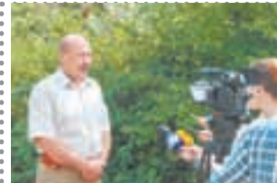
Косят траву на Машуке