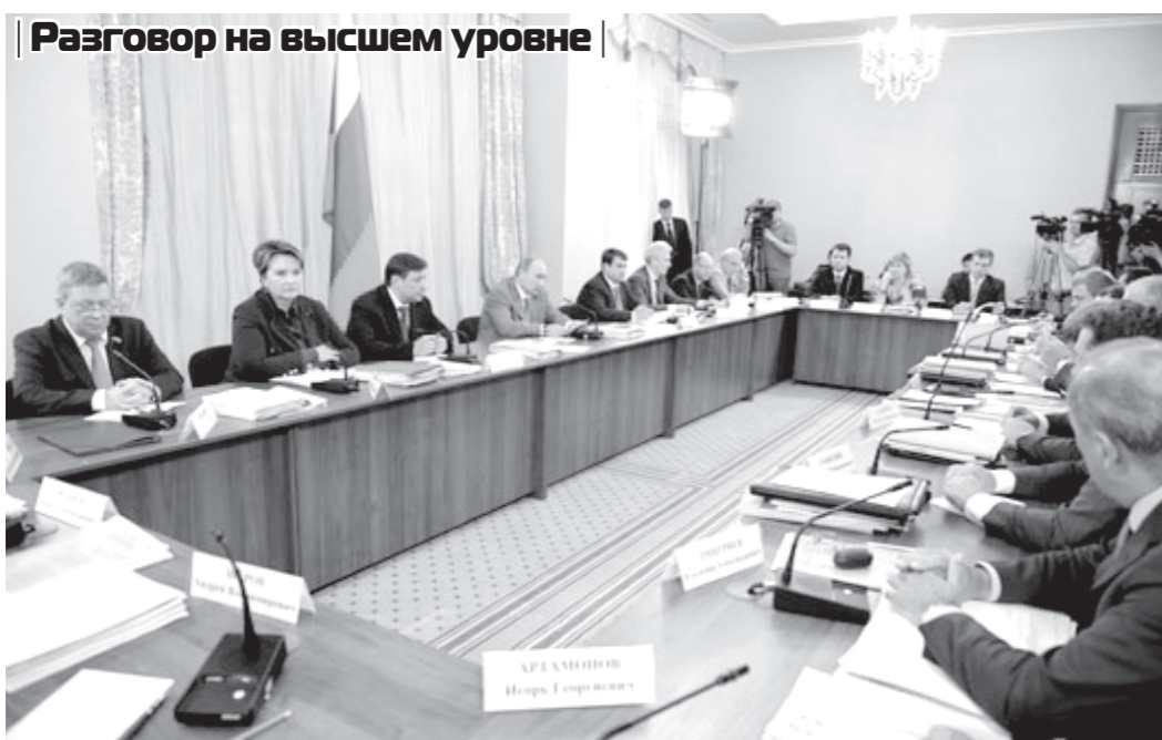
Разговор на высшем уровне