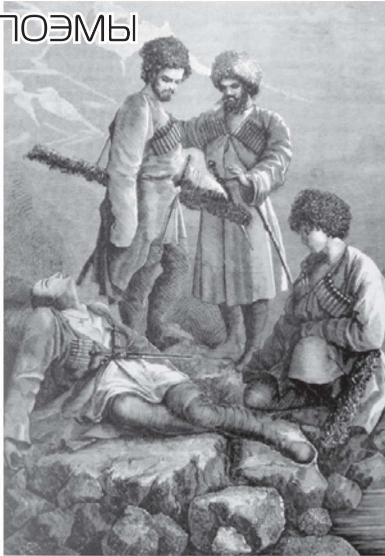
Смерть Измаила. Иллюстрация к поэме М. Ю. Лермонтова «Измаил-бей». Гравюра XIX века.

Имя Измаила Атажукина также очень тесно связано с Кавказскими Минеральными Водами. В своих записках выдающийся доктор Ф. П. Гааз, приехавший в 1810 году на Кавказ для изучения минеральных источников, писал: «Я был очень доволен, когда во время моего вторичного посещения Константиногорска узнал от черкесского князя Измаил-бея, что позади Бештау действительно существует горячий источник, что он сам купался в нем и что он охотно туда бы меня проводил. Я очень обязан князю Измаил-