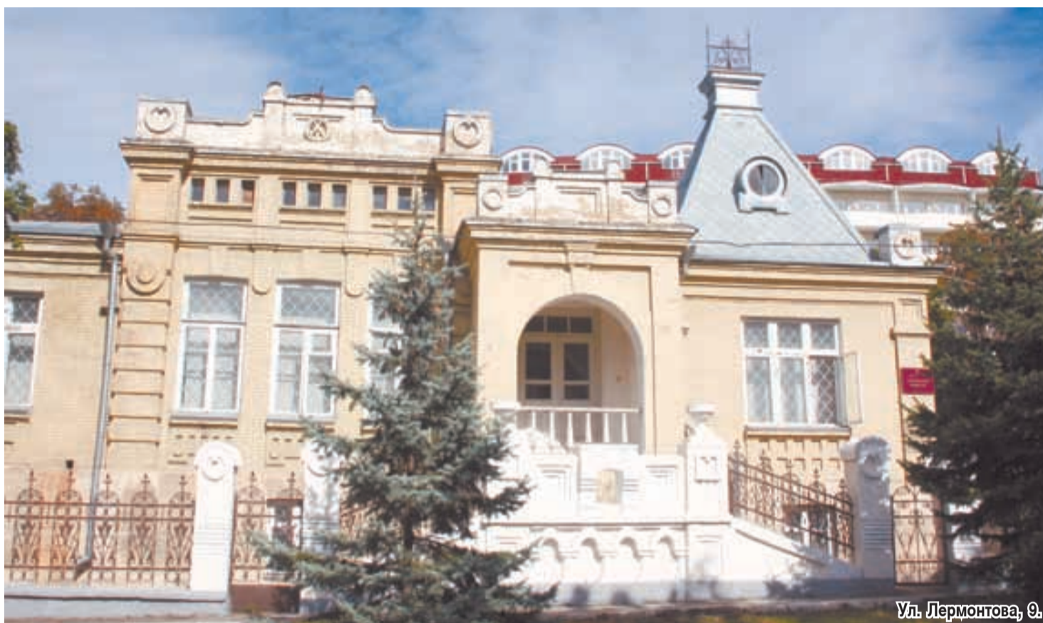
Ул. Лермонтова, 9.