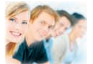
Полосу подготовила Дарья КОРБА.

Необычный вечер знакомств организовала молодежь Пятигорска в минувшую субботу. Желающие встретиться свою вторую половинку юноши должны были вечером прогуливаться по проспекту Кирова с белой розой в руке и вручить ее понравившейся особе. Девушки же шли с бутылочками воды. Если прекрасный принц приходился им по душе, они ставили цветок в эту самую бутылочку. Первые результаты мероприятия показали, что уже таким образом образовалось несколько пар. Подобные вечера знакомств планируется проводить регулярно в разных местах города.