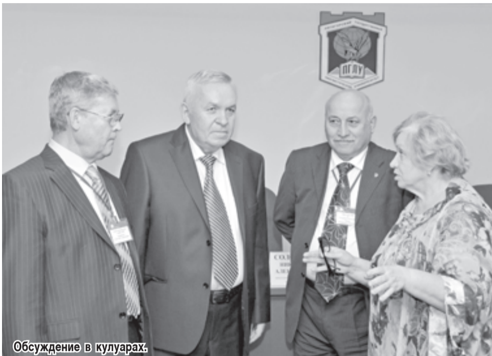
Обсуждение в кулуарах.

О многогранной специфике работы Пенсионного фонда многие люди могут только догадываться, представляя при этом пожилую пару, в дверь к которой стучится почтальон и приносит пенсию. Однако деятельность работников ПФР этим не ограничивается. Пенсионный фонд — это крупная финансовая структура. Парадоксально, но в нашей стране до недавнего времени не было даже факультетов в учебных заведениях, на которых готовили бы специалистов для работы в данной области. Вместе с тем ПФР нуждается в молодых кадрах. Сегодня ситуация кардинально меняется.