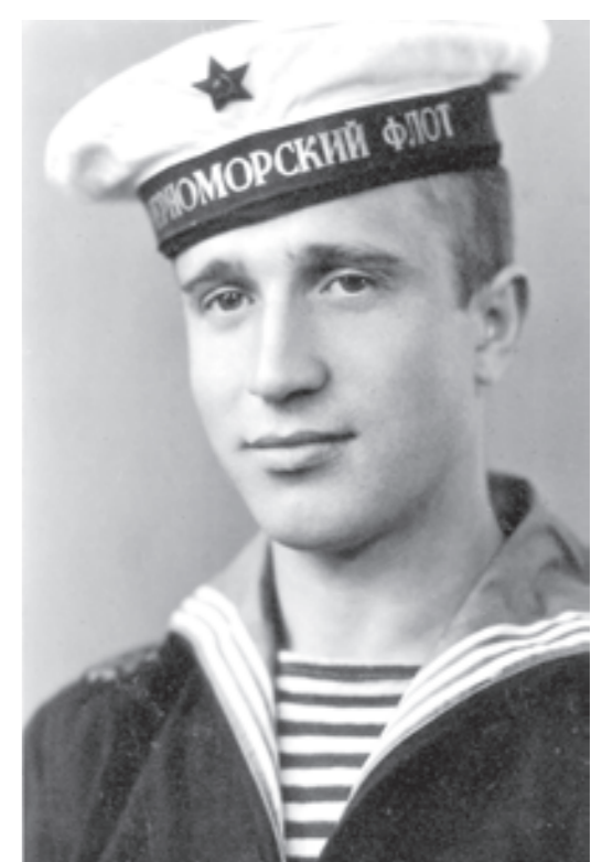
с Северного Кавказа. Теперь эти списки хранятся в Пятигорском краеведческом музее.

уже под водой, корма высоко поднялась. Один за другим некоторые морьяки скатываются по палубе в воду. Скатываюсь и я на башню главного калибра и по скоб-трапу карабкаюсь вверх. Помню только звездное небо и фок-мачту, быстро скользящую по нему, и крик со стороны трапа: «Спасайся, кто может!» Меня резко бросило в башни в воду (25–30 метров). Помню бурлящую ужасную круговерть. Рядом барахтаются люди, мы не понимаем, где верх, где низ, цепляем и бьем друг друга ногами и руками. В голове одна мысль: «Не дышать, сдерживать дыхание». Но уже это невозможно, с первой порцией воздуха вода попадает в легкие. В голове пронеслось: «Мама узнает...» Дальше все куда-то поплыло и исчезло. Очнулся я в воде, среди людской массы, мне удалось попасть на спасательный баркас и с еще многочисленными мучениками добраться до госпитальной