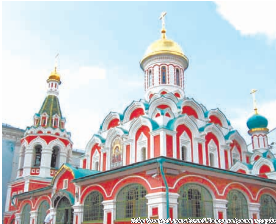
Собор Казанской иконы Божией Матери на Красной площади.