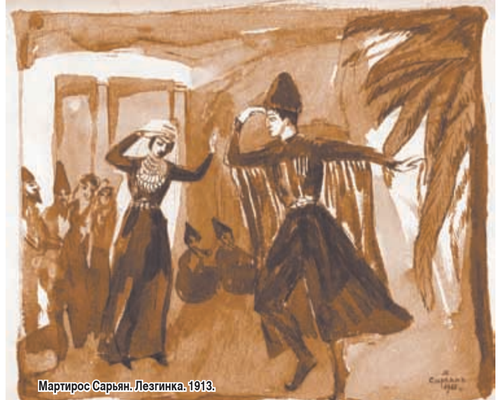
Мартiros Сарьян. Лезгинка. 1913.

На Кавказе у Лермонтова был альбом, в который он заносил черновые наброски стихотворений и заметки на память. Привлекают вни-