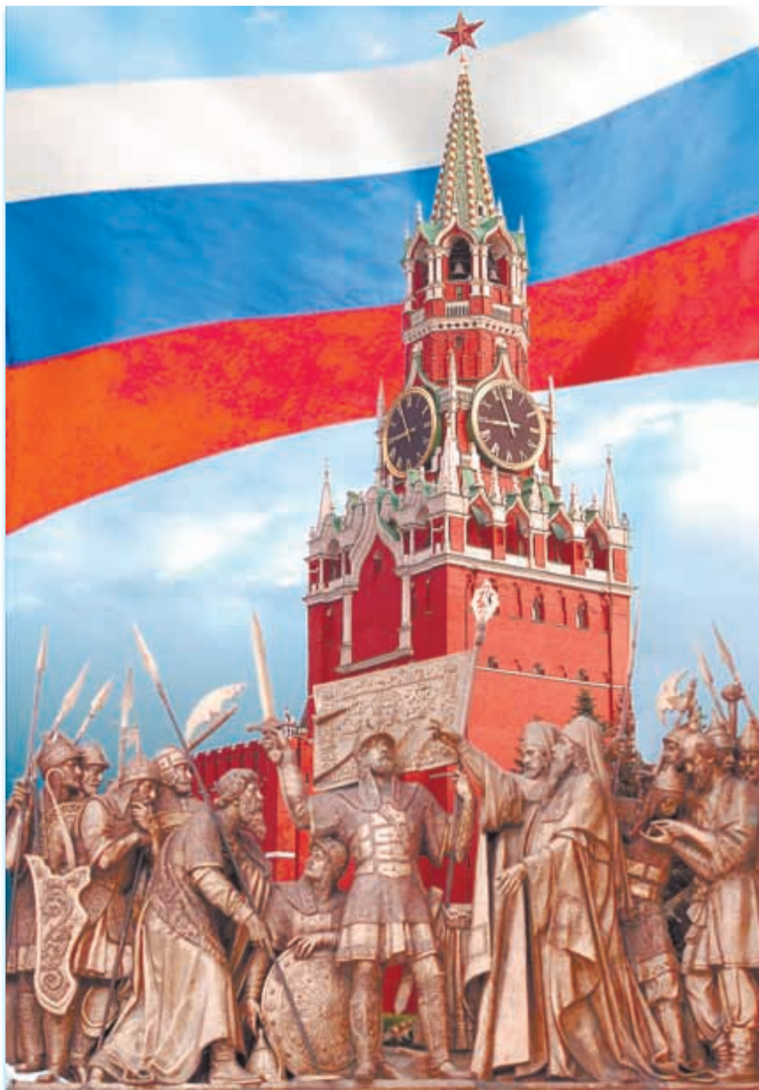
Фотомонтаж Александра ПЕВНОГО.

Под знамена Пожарского и Минина собралось огромное по тому времени войско — более 10 тысяч служилых поместных людей, до трех тысяч казаков, более тысячи стрельцов и множество «даточных людей» из крестьян. С чудотворной иконой