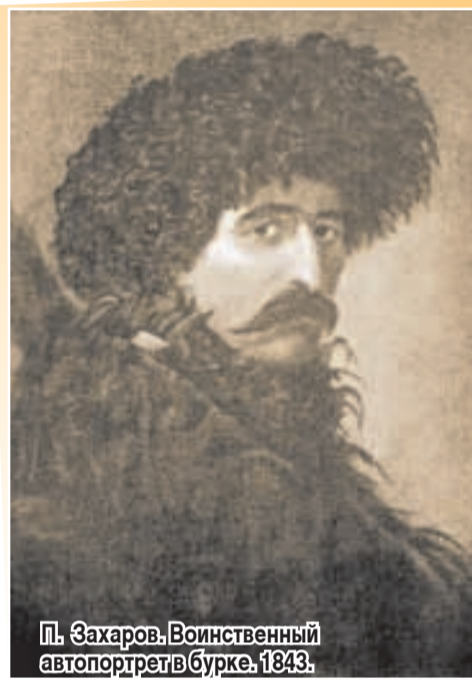
П. Захаров. Воинственный автопортрет в бурке. 1843.

человека, оторванного от Родины, — отмечает исследователь творчества Захарова Н. Ш. Шабаньянц. — Несмотря на то, что художник с самых ранних лет жил в русской семье, он никогда не забывал о своем народе и до конца жизни оставался верен ему».