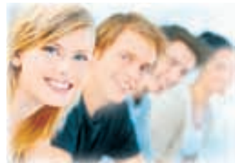
Полосу подготовила Дарья КОРБА.

В Ессентуках состоялась 12-я Всероссийская научно-практическая конференция «Развитие социальных и образовательных проектов Специальной Олимпиады России среди молодежи в условиях модернизации Российского общества». Ее цель — оказание методической помощи региональным отделениям в развитии движения, его пропаганда. В мероприятии приняли участие представители движения из разных областей и регионов страны. СКФО был представлен Ставропольским краевым отделением, действующим на базе Балахоновского психоневрологического интерната. В рамках конференции прошли пленарное заседание, показательные спортивные соревнования и молодежный форум.