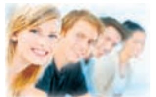
Полосу подготовила Дарья КОРБА.

На днях в Институте международного сервиса, туризма и иностранных языков ПГЛУ состоялся концерт «Все мы разные, но все мы вместе», посвященный Международному дню толерантности. В традиционном ежегодном мероприятии студенты представили свои национальные песни и танцы. Гости концерта смогли окунуться в увлекательный и многогранный мир культуры русского, армянского, грузинского, еврейского, кабардинского, балкарского, украинского и других народов.