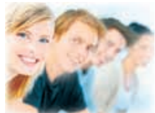
Полосу подготовила Дарья КОРБА.

11 ноября студенты и преподаватели Института филологии и спортивно-туристического менеджмента ПГЛУ в 11 часов 11 минут отметили «магическую» дату. Такое редкое сочетание шести единиц (11:11:11 11.11.11) случается лишь раз в сто лет. Под радостные возгласы в небо выпустили шары, запустили фейерверки и успели загадать самые заветные желания все участники мероприятия!