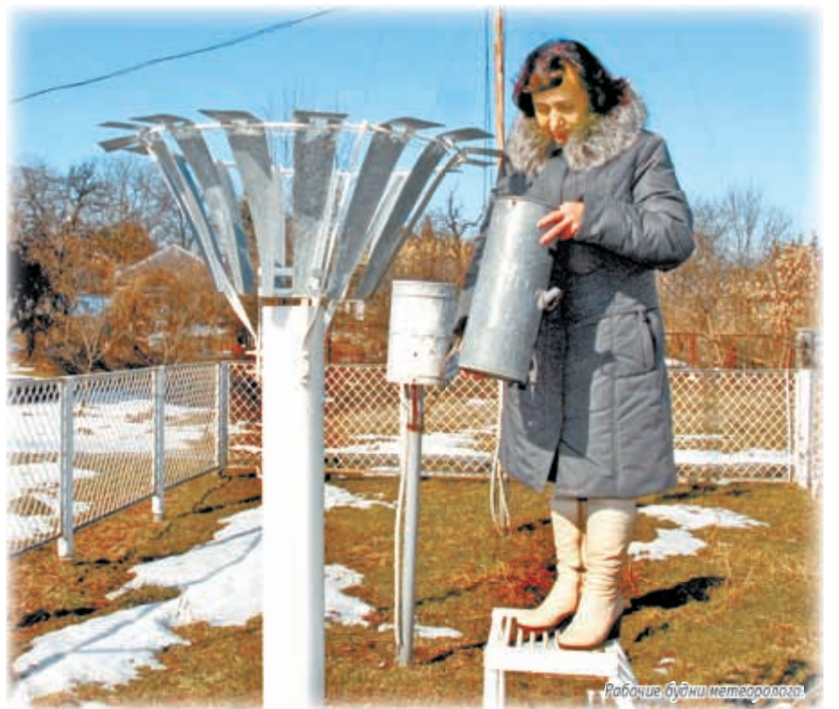
Рабочие будни метеоролога