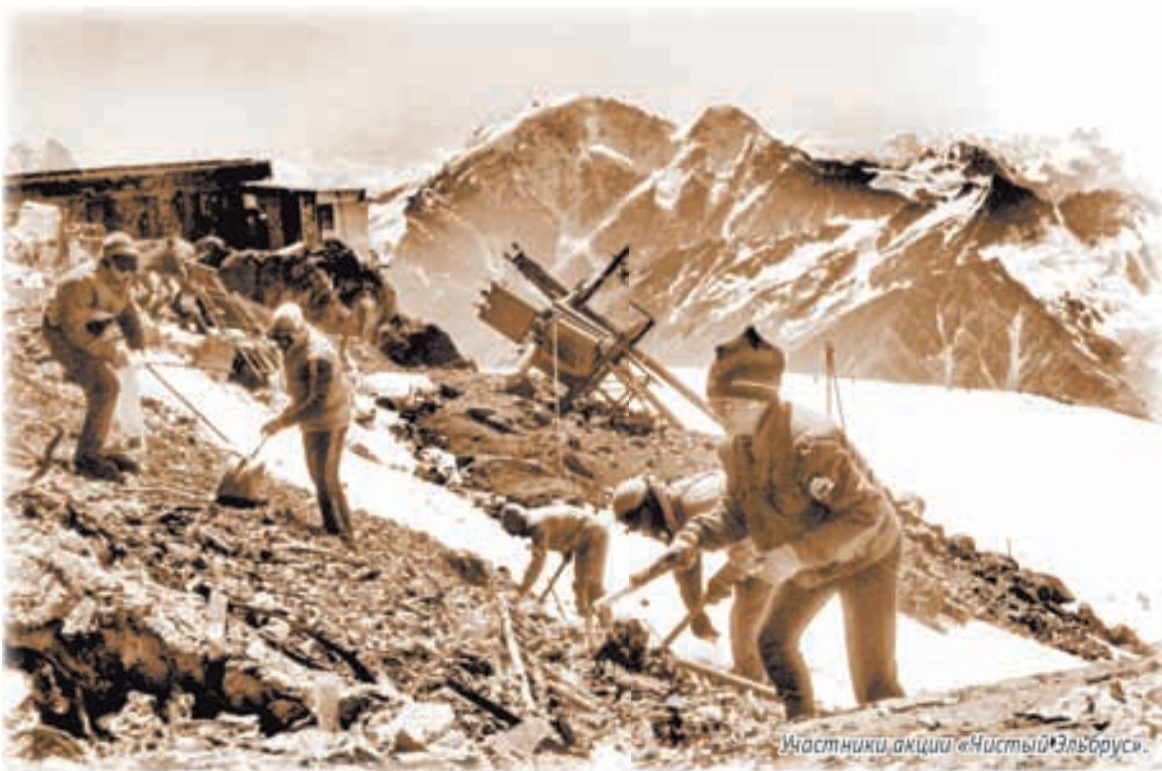
Участники акции «Чистый Эльбрус».

«Когда Земля вскрикнула» он словами одного из героев, профессора Челленджера, говорит о том, что растения, покрывающие ее поверхность, очень напоминают растительность на теле животного, вулканы — тепловые точки, приливы и отливы — дыхание. Роман заканчивается