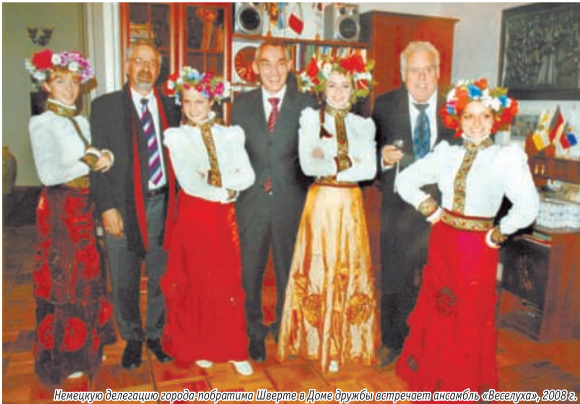
Немецкую делегацию города-побратима Шверте в Доме дружбы встречает ансамбль «Веселуха», 2008 г.

Анна ЦИГЕЛЬСКАЯ.