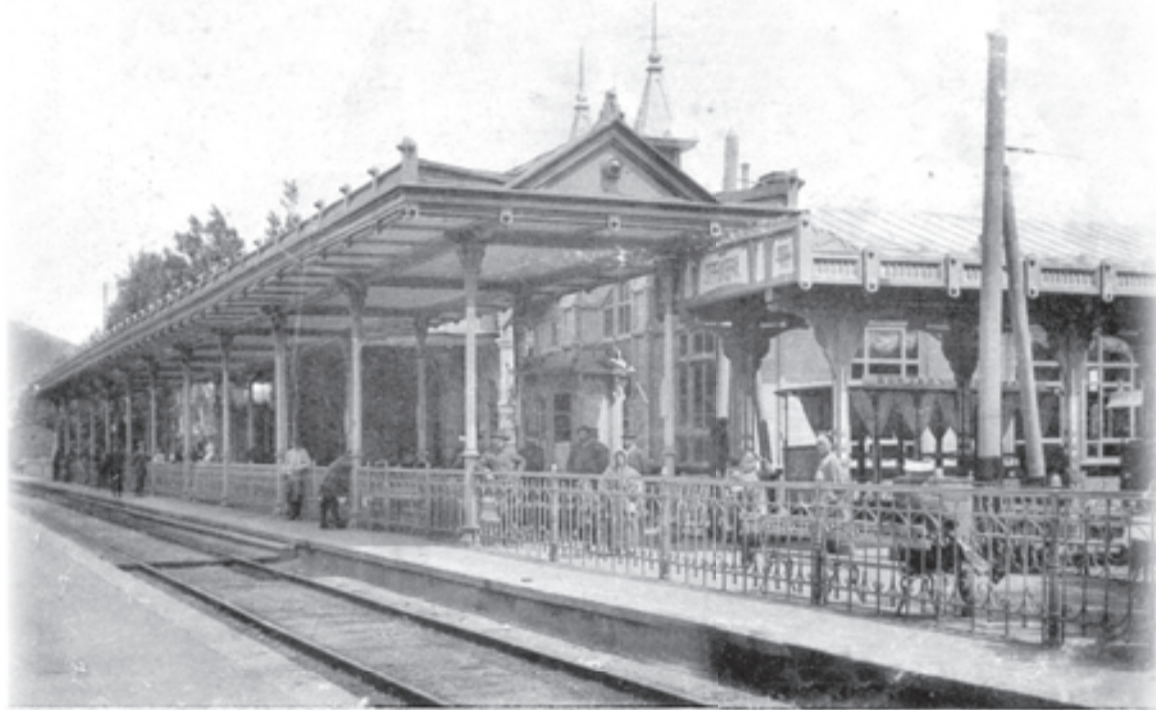
Гор. Пятигорск. Вокзал и остановка электрической трамвая.

Пятигорский вокзал, конечно, не столь оживлен, как столичные, но и он бывает очень многолюден — порою на перронах собираются сотни людей. И большинство их воспринимает существующий ныне вокзал со всем окружающим как само собой разумеющееся. О том, что стояло здесь когда-то другое здание и все вокруг него было по-иному, вспоминают немногие. Ведь как-никак тридцать с лишним лет прошло с тех пор, как начались здесь грандиозные перемены, в результате которых засверкал громадными окнами бетонный параллелепипед нового вокзала, взметнулась рядом с ним гостиница-«высотка», нырнул под пути подземный переход, а старое вокзальное здание исчезло, как будто его никогда и не было. Но, заглянув в прошлое, можно увидеть, как возник «парадный подъезд» Пятигорска.