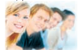
Полосу подготовила Дарья КОРБА.

В Институте германских языков, международного маркетинга и инноватики ПГЛУ состоялся концерт «Музыкальная Вена» (в рамках работы клуба «Здесь говорят по-немецки»). Мероприятие было посвящено творчеству Иоганна Штрауса — «короля вальса». Сообщения студентов иллюстрировала презентация. Разумеется, вальсировали молодые люди под музыку И. Штрауса.