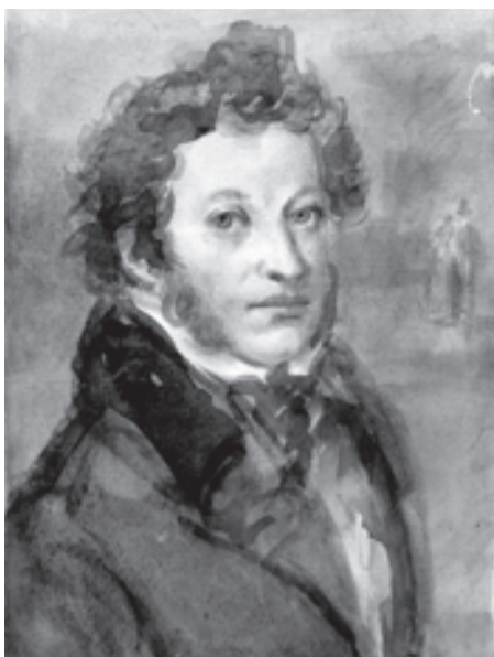
А. С. Пушкин. Акварельный портрет работы К. И. Рудакова (Собрание Государственного музея-заповедника М. Ю. Лермонтова).