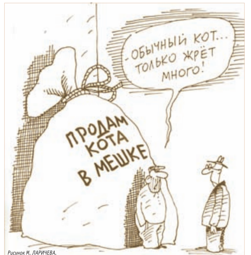
Рисунок М. ЛАРИЧЕВА.

Однако простые паспорта будут выдавать и после 2015 года — они потеряют юридическую силу только спустя десять лет.