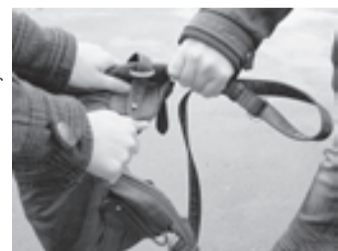
19 января во время несения службы экипаж Госавтоинспекции пятигорской полиции заметил бежавшего по улице мужчину с женской сумкой в руках.