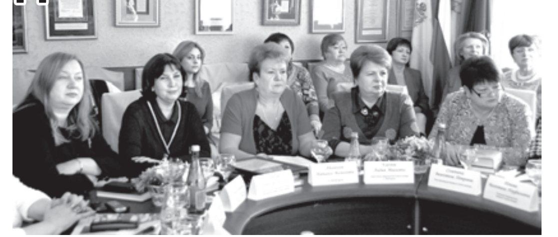
За последнее время заметно активизировали работу общественные женские организации Ставрополья. Они взяли под свою опеку социально незащищенные и многодетные семьи, стариков, детей, попавших в трудную жизненную ситуацию. Женсоветы устраивают праздники, проводят благотворительные акции, смотры, конкурсы, фестивали.

О ВОЗРОСШЕМ влиянии женского движения на общественно-политическую жизнь Ставрополья, проблемах и задачах на предстоящий год шел разговор на семинаре председателей районных и городских Советов женщин, который прошел в сатнатории «Пятигорский наразан».