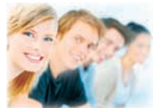
Полосу подготовила Дарья КОРБА.

В Ессентуках прошел Первый молодежный форум «Студ-День» — образовательная площадка для обмена знаниями с профессионалами в самых разных сферах деятельности. В рамках мероприятия были организованы мастер-классы по четырем направлениям: Events, где рассматривали проекты и их планирование, предпринимательство и возможности реализации творческого потенциала посредством бизнес-идей; PR, где объясняли, что это такое и как правильно пользоваться его инструментами; Волонтерство для тех, кому интересна добровольческая тема; а также Социальное проектирование, где участникам рассказывали о грантовом конкурсе Северо-Кавказского форума «Машук-2014». Всего в «СтудДне» приняли участие 160 человек.