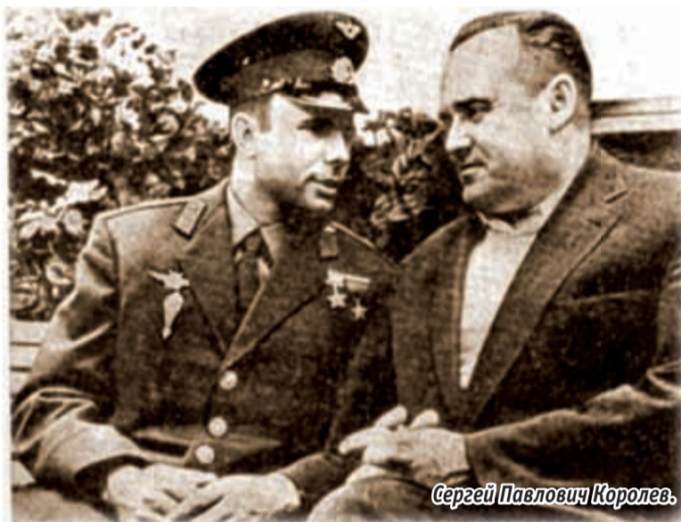
Сергей Павлович Королев.

был предельно прост: сферический корпус, внутри радиопередатчик, система терморегулирования, датчики температуры и давления. Позывные «Бип! Бип!» ловили радиолюбители всего мира. Изучение этого сигнала и наблюдения спутника дали инженерам важные на тот момент научные данные. Аппарат пробыл на орбите три месяца, после чего сгорел в атмосфере.