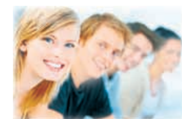
Полосу подготовила Дарья КОРБА.

Российская Федерация вошла в список 30 лучших стран для молодежи. Об этом говорится в опубликованном на днях Глобальном рейтинге благополучия молодежи, подготовленном Международным фондом молодежи и американским Центром стратегических и международных исследований. В ходе исследования эксперты измеряли качество жизни молодых людей в возрасте от 10 до 24 лет, основываясь на различных показателях: вовлеченности в гражданскую активность, экономических возможностях, образовании, здравоохранении, коммуникационных технологиях и безопасности.