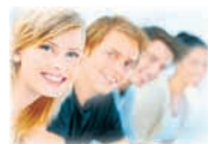
Полосу подготовила Дарья КОРБА.

Всю необходимую информацию можно получить, перейдя по ссылке http://kvadrokross.ru/participants/r...ion-online.php