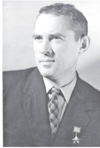
в боях за Родину, в которой рассказано о его подвиге, и подарил ее мне».