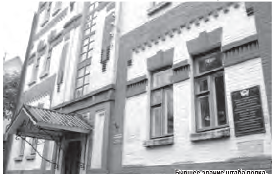
Бывшее здание штаба полка.

ВОЕННАЯ техника неизменно приводит их в восторг, но советский Т-34 — тема особая. И в глазах школьников уже не беспечное озорство. Забираясь на холодную броню, срывая застывшие капли с мощной пушки, в эту минуту они видят себя не юнцами, а настоящими солдатами.