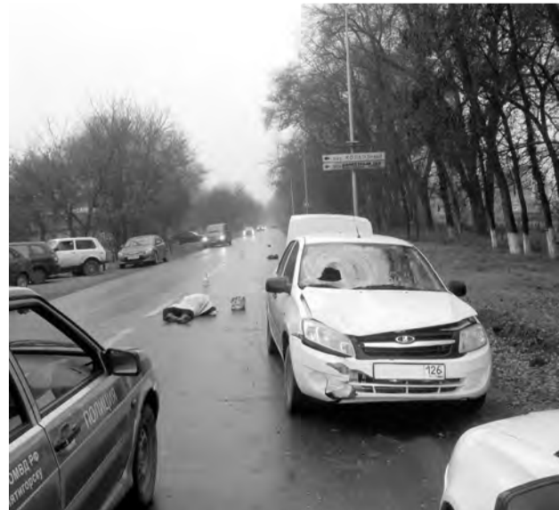
Полосу подготовила Татьяна ПАВЛОВА.

В ПОНЕДЕЛЬНИК в 7 часов 30 минут на улице Ермолова в Пятигорске водитель такси «Лада Гранта» сбил пенсионерку, которая переходила проезжую часть в неустановленном месте. В результате ДТП 66-летняя местная жительница от полученных травм скончалась на месте происшествия. Предварительная причина ДТП — переход проезжей части в неустановленном месте. Руководство Отдела ГИБДД по городу Пятигорску настоятельно призывает всех участников дорожного движения строго соблюдать ПДД, пересекать улицу только по зебре и на разрешенный сигнал светофора. Водителям — не превышать допустимую скорость, учитывать погодные условия. Напомним, в этом году это уже четвертый случай, когда на дороге гибнет пешеход.