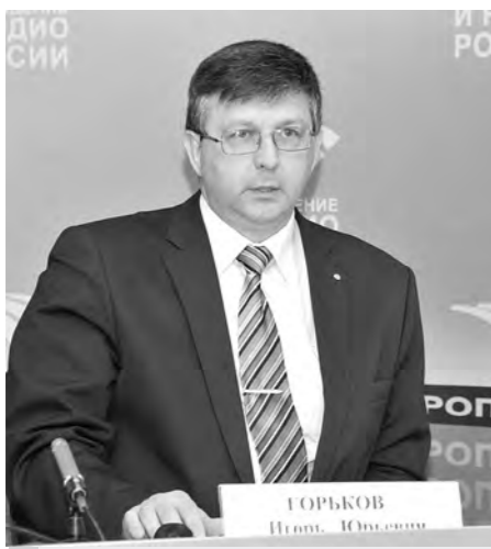
«Наркоситуация в субъектах Северо-Кавказского федерального округа и результаты противодействия незаконному обороту наркотиков в 2014 году».