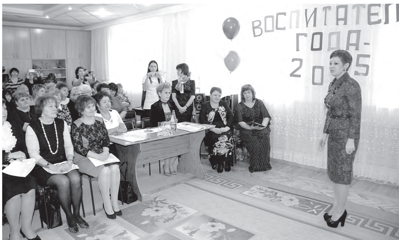
На днях пятигорский детский сад № 46 «Мишутка» радушно открыл свои двери для гостей, жюри и, конечно же, финалистов городского этапа конкурса профессионального мастерства «Воспитатель года-2015».

В ЭТОМ году за право называться лучшими боролись одиннадцать педагогов. Семеро из них, специалисты с серьезным опытом, выступали в номинации «Лучший воспитатель». А оставшаяся «великолепная четверка» — молодежь, чей стаж работы составляет от года до трех лет, — испытала себя в нововведенной номинации «Педагогический дебют».