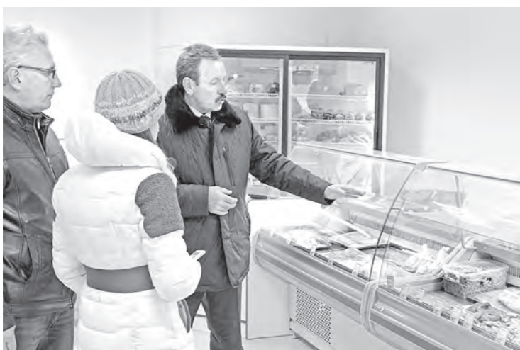
В Пятигорске прошел очередной рейд, направленный на выявление торговых точек, где продают мясо без соответствующих разрешительных документов и санитарной проверки. Перед рейдовой бригадой, в которую вошли представители Роспотребнадзора, полиции, ветеринарных служб и СМИ города, была задача выявить нарушителей.