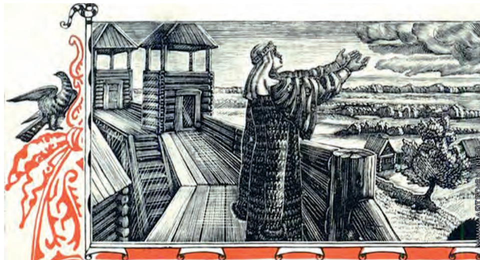
Плач Ярославны. Гравюра на дереве В. А. Фаворского.

— постоянные эпитеты, олицетворения, метафоры, гиперболы, параллелизмы и т. д. Его высокое мастерство проявляется и в стройной композиции «Слова», и в богатстве языка, и в ярких образах. Разве не пленяет нас русская женщина-патриотка, жена князя Игоря Ярославна? Ее «Плач» играет тоже важную роль в реализации идейного смысла произведения. По глубине чувства, по художественной выразительности он имеет мало равных во всей мировой литературе. «Ни в одном произведении, — подчеркивал А. С. Пушкин, — нет столько поэзии, сколько находится оной в плаче Ярославны».