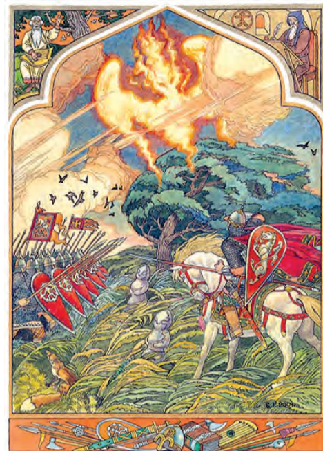
Иллюстрация к поэме «Слово о полку Игореве». Художник В. Корольков.

Короче говоря, автор «Слова» в своем патристическом порыве сумел использовать все художественные средства для выполнения сверхзадачи — помочь современникам объединиться в борьбе с многочисленными врагами Руси, предупредить