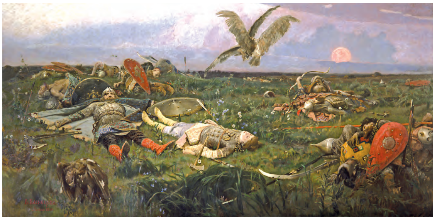
После побоища Игоря Святославича с половцами. Художник В. М. Васнецов.