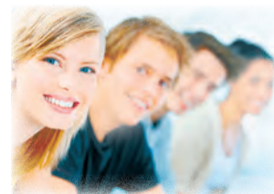
Полосу подготовила Дарья КОРБА.

В планах организаторов «Машука-2015» — предложить известным российским бизнесменам стать идеологами-вдохновителями смены «Предпринимательство», которая пройдет с 31 июля по 7 августа в Пятигорске, а также принять непосредственное участие в работе, помогая молодым предпринимателям в развитии бизнеса в формате личных консультаций.