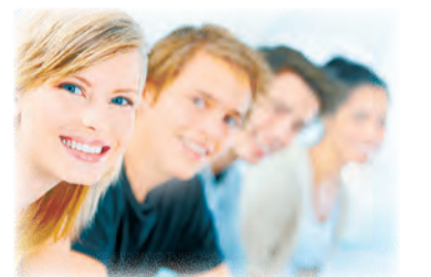
Полосу подготовила Дарья КОРБА.

В Пятигорске в рамках центрального проекта «70 шагов к Победе» на базе Центра реализации молодежных проектов и программ» состоялся показ кинофильма «Брестская крепость». На показе присутствовали ветераны Великой Отечественной войны, представители общественно-политических, молодежных и казачьих организаций, Совета женщин города, активисты ПГОО «Союз молодежи Ставрополья», учащиеся средних школ, вузов и ссузов.