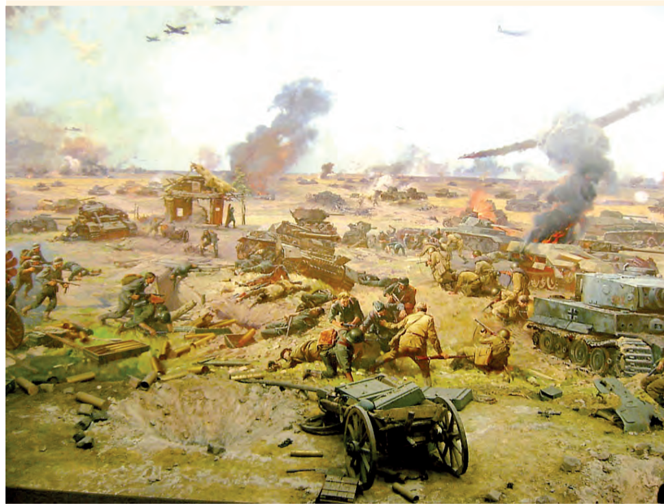
Битва на Курской дуге 1943 г.

8 февраля. Под городом Краматорском крепко бомбили.