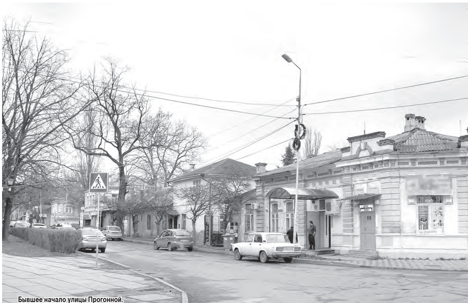
Бывшее начало улицы Прогонной.

Вадим ХАЧИКОВ, заслуженный работник культуры РФ.