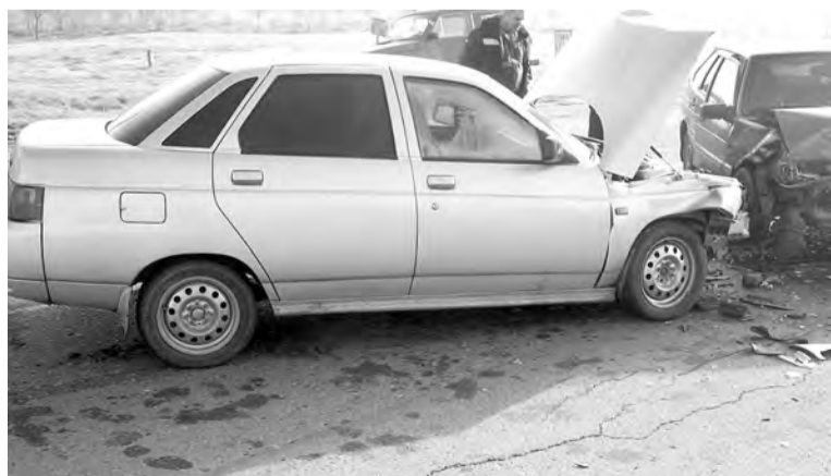
Полосу подготовила Татьяна ПАВЛОВА.

Вместе с сотрудниками ДПС на аварию приехали пожарные ПЧ № 28 ПАСС СК села Урожайного. Пьяный водитель, испугавшись наказания, попытался скрыться с места происшествия, но его поймали и заставили поехать на медицинское освидетельствование. Пассажеры поставили разбитую «десятку» на колеса, вытащили на дорогу, после чего ее забрал эвакуатор.