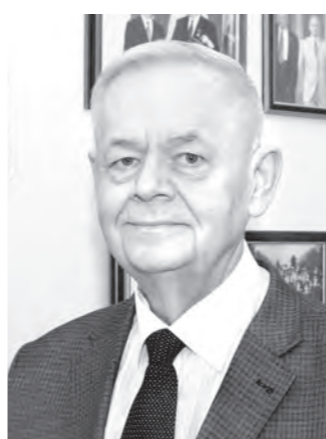
Президента Российской Федерации.

В 2008 году нашему земляку была объявлена Благодарность