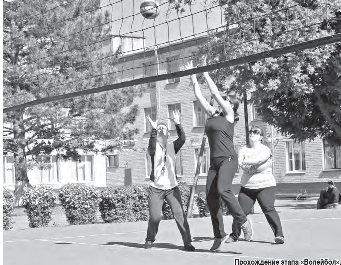
Прохождение этапа «Волейбол».