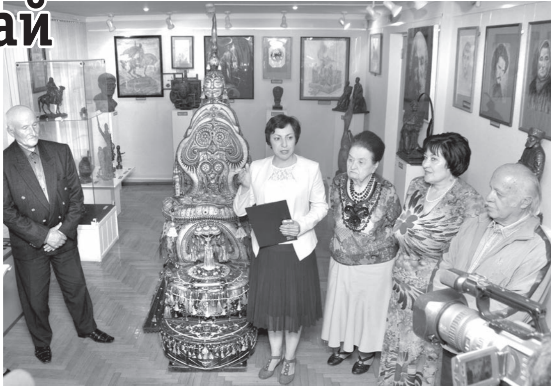
памятников, пейзажи, воспевающие красоту родных просторов, наполнены глубоким лиризмом, свидетельствуют о таланте мастера.