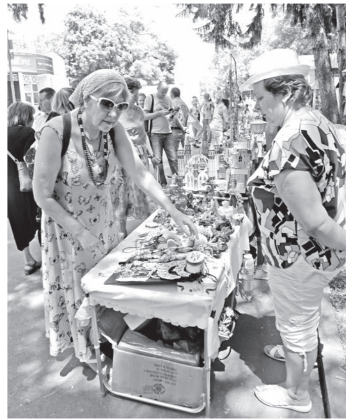
Этот веселый праздник в честь всероссийского Дня семьи, любви и верности был организован Пятигорской и Черекской епархией и Домом национальных культур...