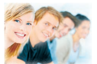
Полосу подготовила Дарья КОРБА.

Не позднее 1 ноября члены Экспертного совета Премии отберут не более 40 участников в каждой конкурсной номинации для участия во Всероссийском очном этапе.