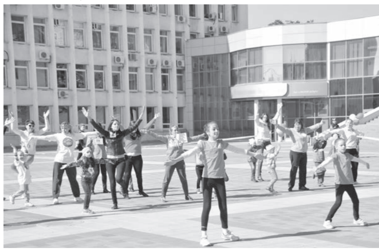
Многочисленные велофестивали. Наша цель — показать пятигорчанам, как весело, интересно и полезно заниматься спортом всей семьей.

горской ДЮСШОР № 4 совместно с управлением образования администрации Пятигорска.