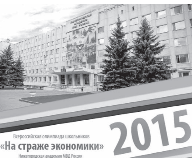
Всероссийская олимпиада школьников «На страже экономики» 2015 Нижегородская академия МВД России

Пресс-служба отдела МВД России по г. Пятигорску.