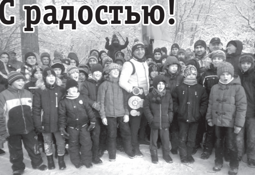
Традиционное восхождение на гору Машук состоялось в Пятигорске.

Всего более 250 человек пришли на старт, который расположился около Поляны песен.