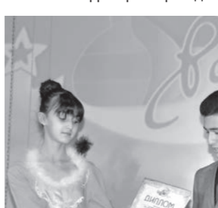
Награждение победителей в специальных номинациях.

стивала оформилась в отдельный благотворительный проект «Православные храмы Ставрополя».