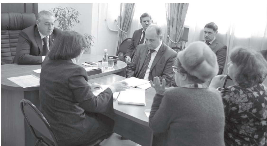
«Окончание. Начало на 1-й стр.»

Ремонт и благоустройство сквера Анджиевского пятигорчане, безусловно, заметили и оценили. Но есть и замечания: стихийная свалка на углу возле трамвайной линии портит всю картину. Если осенью это еще можно было списать на деятельность дворников и необходимость временно ставить здесь мусорки с убранными листьями и прочим мусором, то зимой такая ситуация вызывает закономерную досаду и множество вопросов.