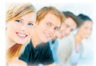
Полосу подготовила Дарья КОРБА.

Учащиеся школы № 1 г. Лермонтова побывали на экскурсии в воинской части. Ребятам показали не только военную технику, учебные классы и музей, но и быт солдат. Благодаря общению с теми, кто уже проходит военную службу, дети могли из первых уст узнать интересующую их информацию, напрямую задать вопросы. Главная цель мероприятия — ознакомить школьников со службой, наглядно продемонстрировать график солдат, предоставить им возможность пообщаться с военнослужащими, развеять страхи и сомнения. Такие уникальные поездки однозначно способствуют формированию положительного образа армии.